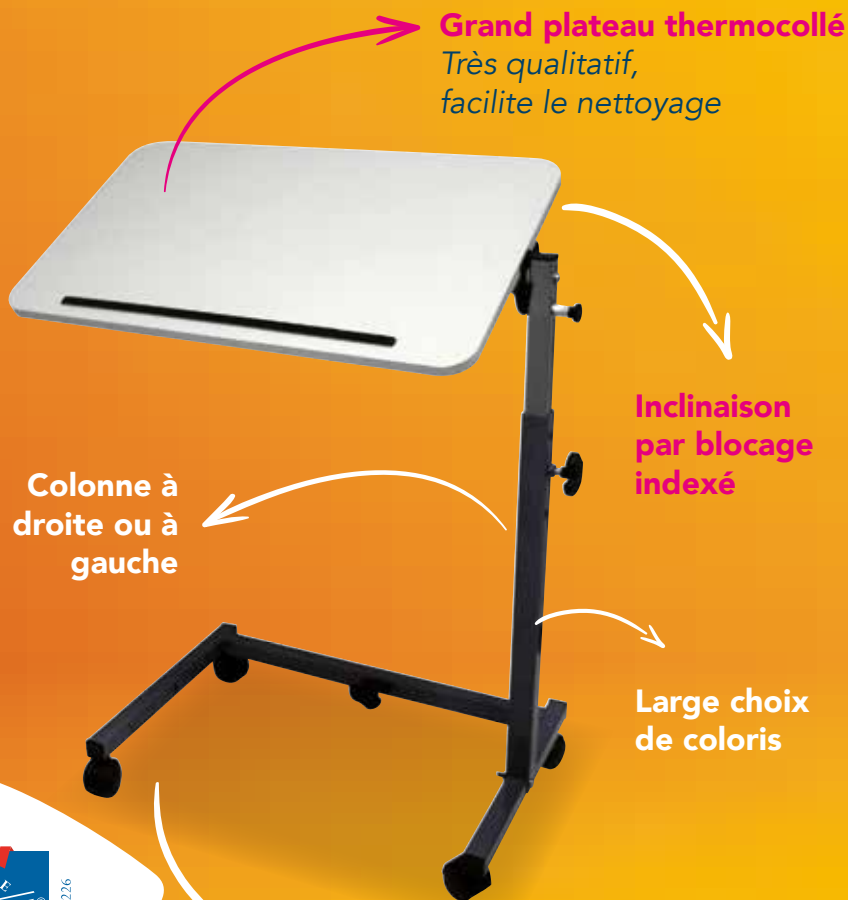
Table AC 207

Grand plateau thermocollé Très qualitatif, facilite le nettoyage